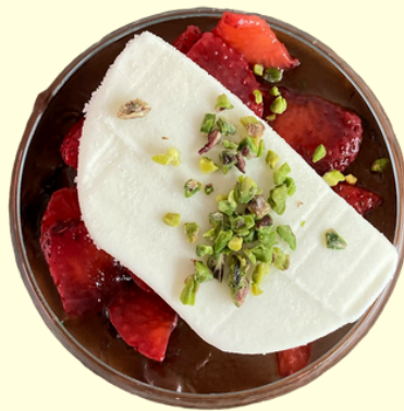
SWEET BOWL / 270