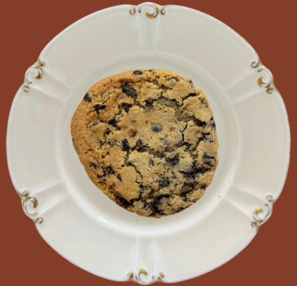
COOKIE / 115