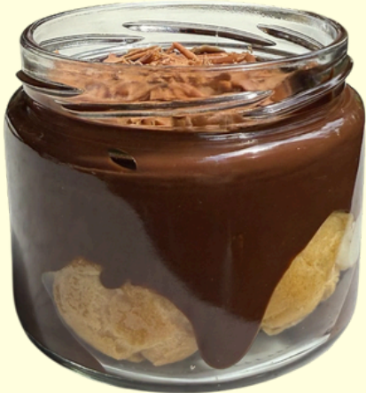
PROFİTEROL / 225