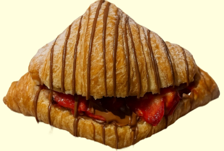
KESME CROISSANT / 300

Çilek, çikolata, muz, pastacı kreması, çikolata