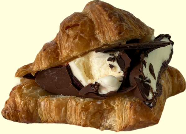
MAGNUM ICE CROISSANT / 370