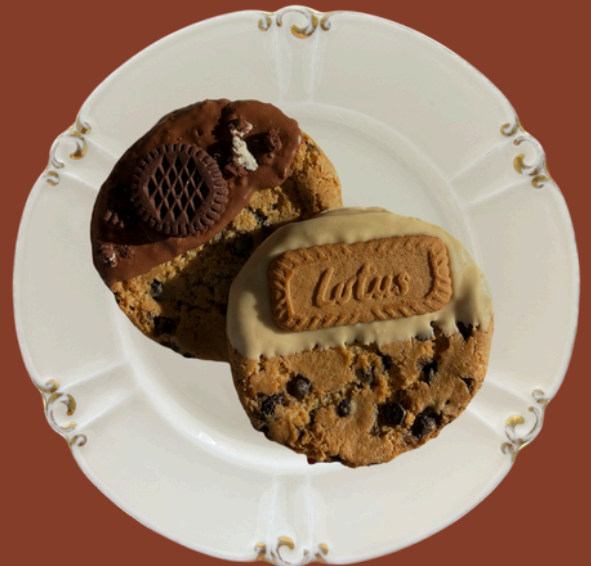
PREMIUM COOKIE / 145