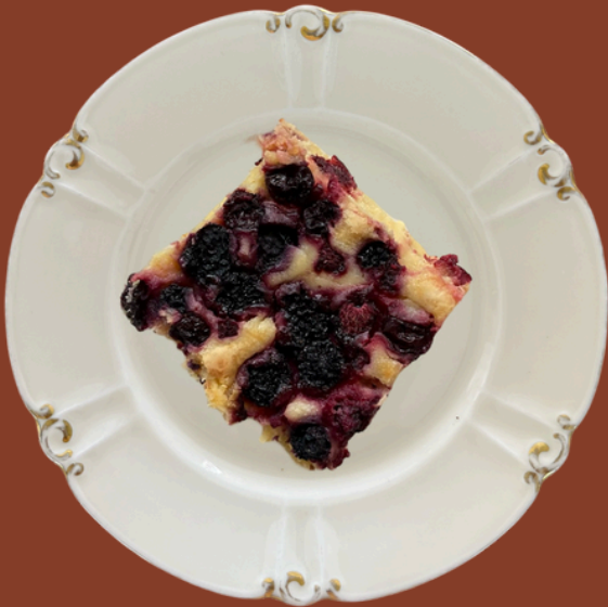
BLONDIE / 285