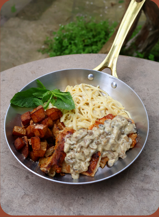
MASHROOM CHICKEN / 420

Kremalı makarna, fırında özel patates, mantar soslu pizola