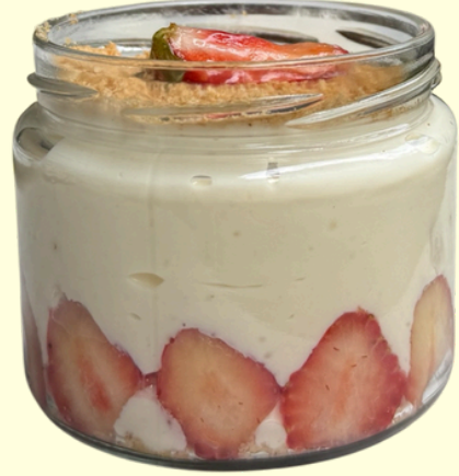
ÇİLEKLİ MAGNOLYA / 195