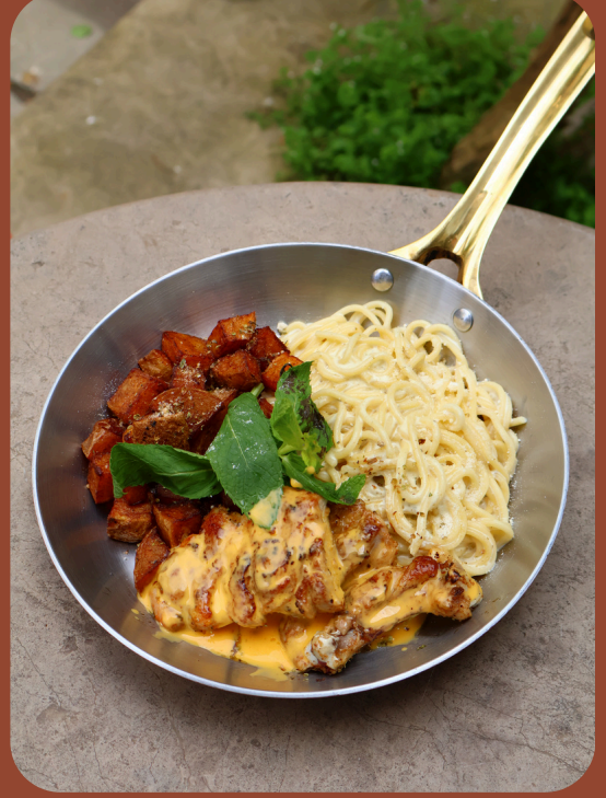
CHEDAR CHICKEN / 400

Kremalı makarna, fırında özel patates, mantar soslu pizola