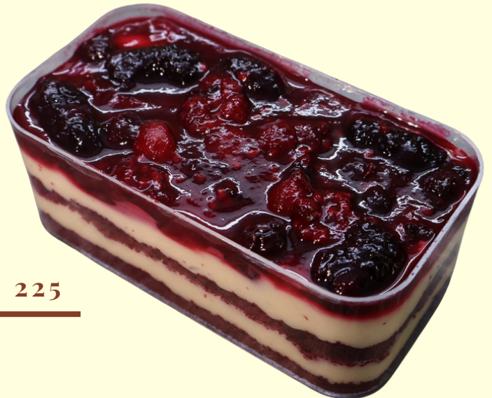
ORMAN MEYVELİ SPOONFUL / 225