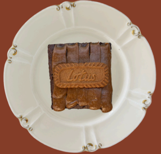
LOTUSLU BROWNIE / 265