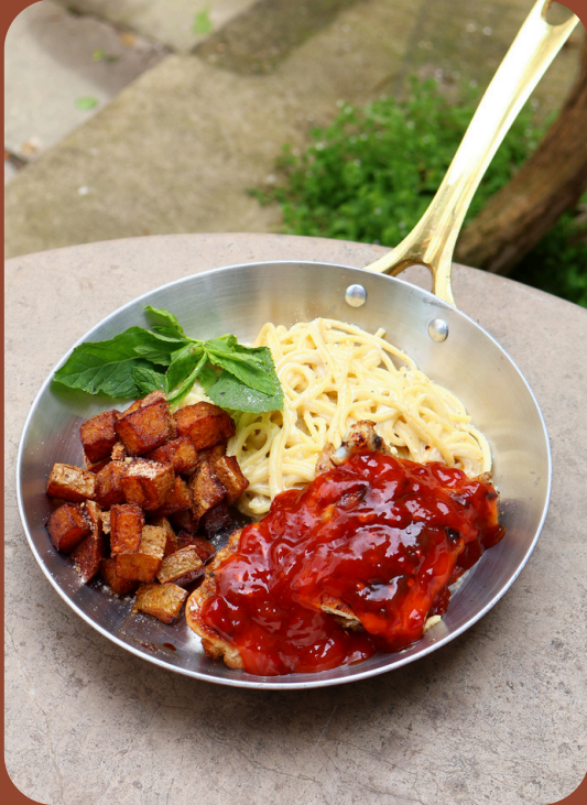
SWEETCHILI CHICKEN / 390

Kremalı makarna, fırında özel patates, chedar soslu pizola