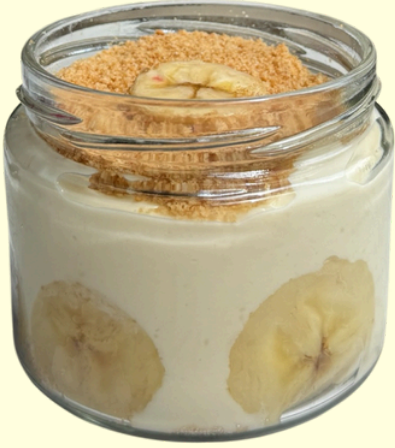
MUZLU MAGNOLYA / 195