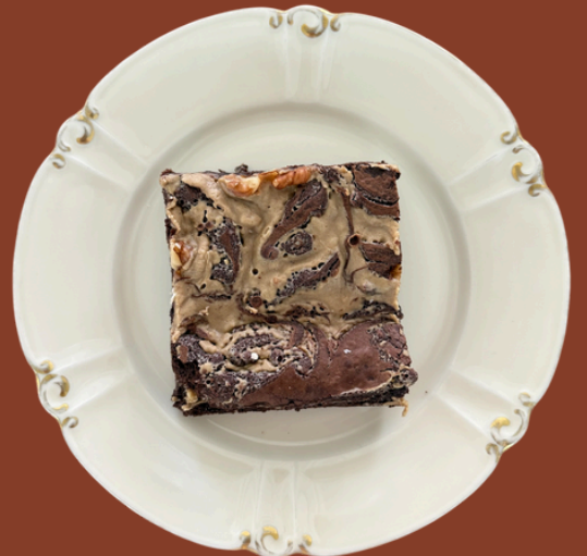
TAHİNLİ CEVİZLİ BROWNIE / 275