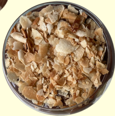
PATRICA / 270