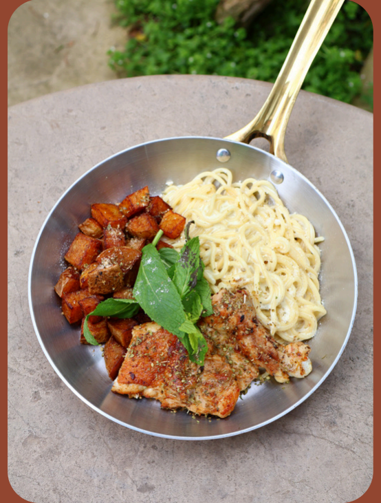
OREGANO CHICKEN / 385

Kremalı makarna, fırında özel patates, sweetchili soslu pizola