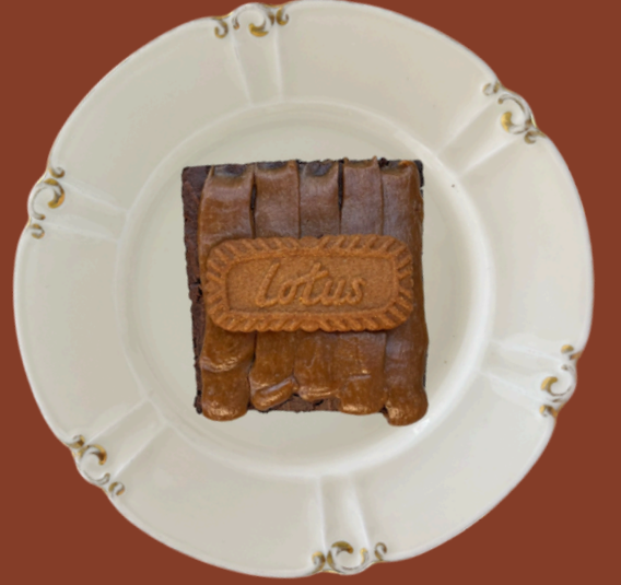
LOTUSLU BROWNIE / 235