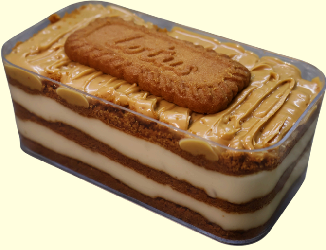
LOTUSLU SPOONFUL / 200