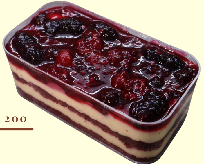
ORMAN MEYVELİ SPOONFUL / 200