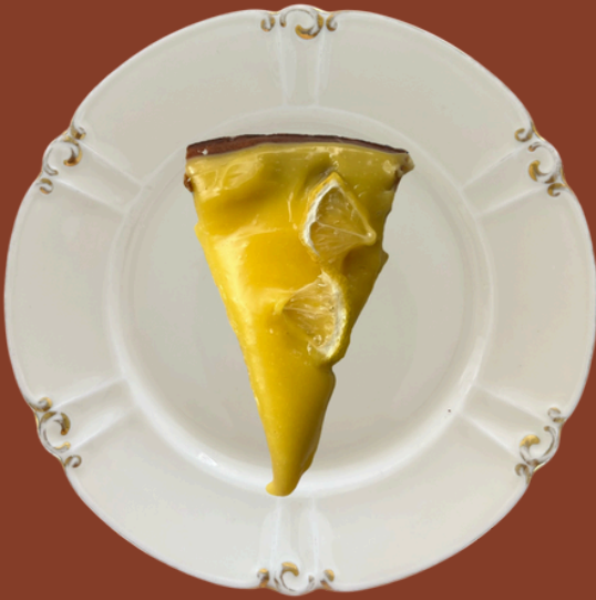
LİMONLU CHEESECAKE / 225