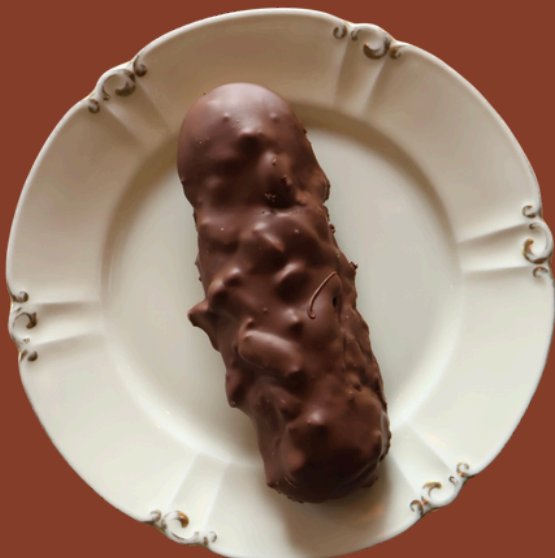
SNICKERS PASTA / 275