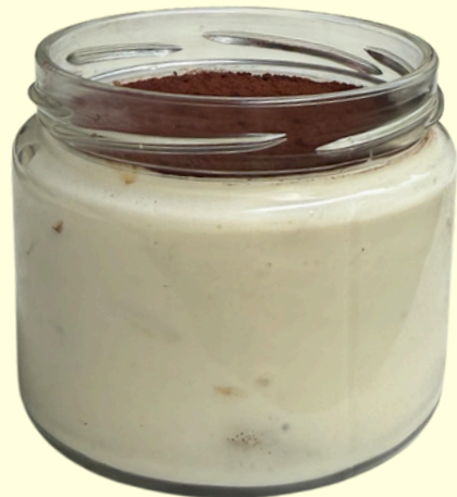
TIRAMISU / 200