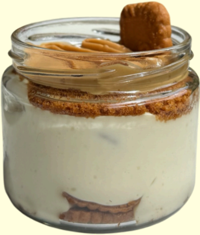
LOTUSLU CUP / 200