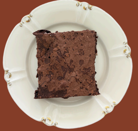
BROWNIE / 225