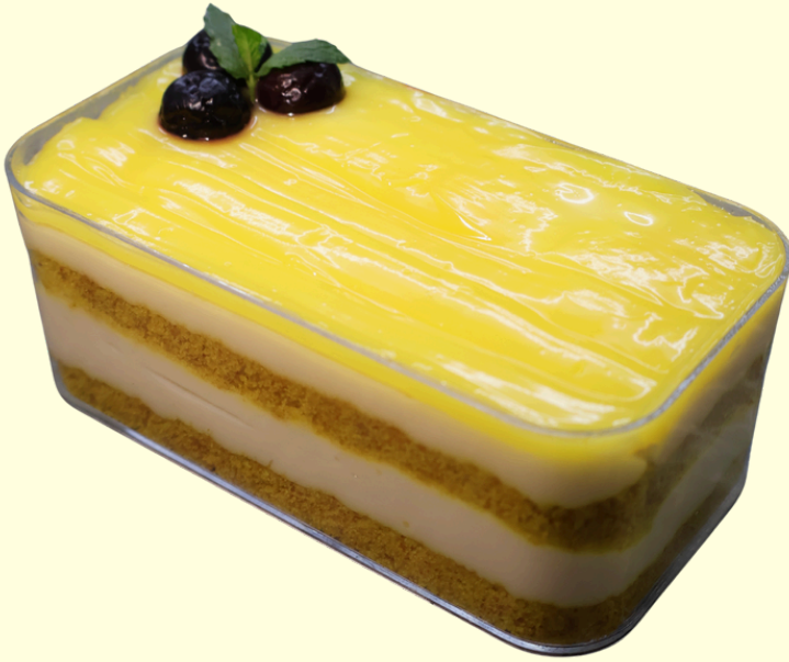
LİMONLU SPOONFUL / 200