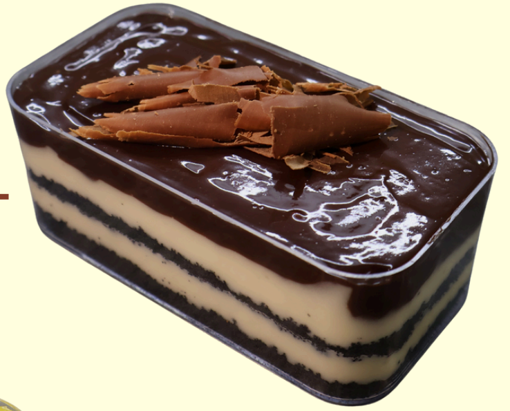
ÇİKOLATALI SPOONFUL / 200