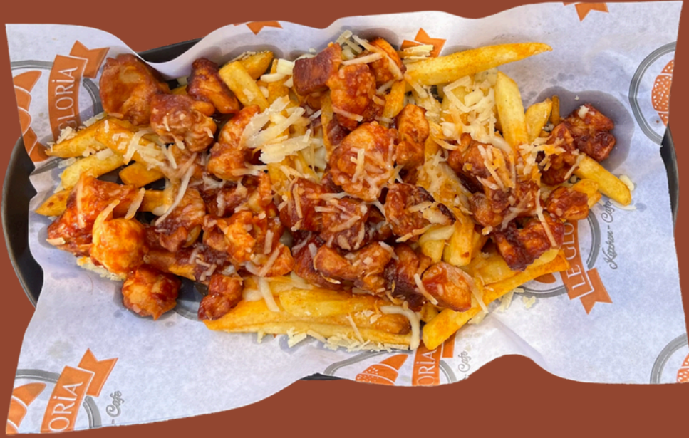
AVEREL DALTON / 360 Tavuk, sos, domates, pesto, parmesan