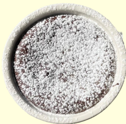
SUFLE / 245