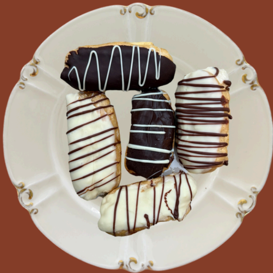
EKLER / 200