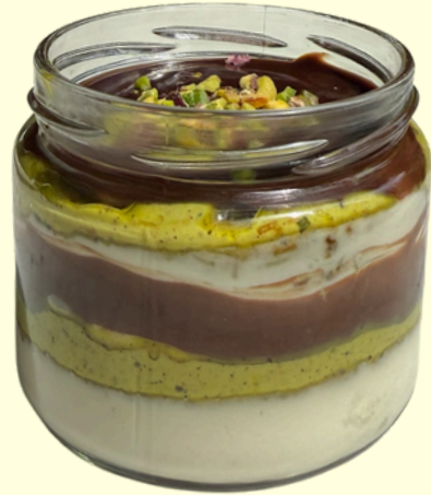
FISTIK RÜYASI / 270