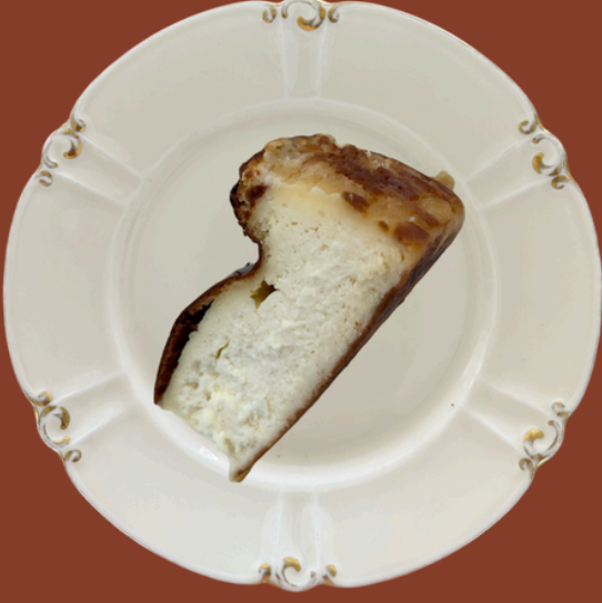
SAN SEBASTIAN / 225