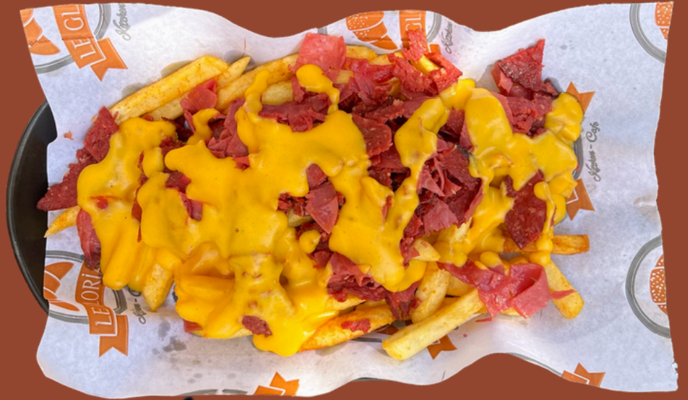
REDKIT / 385 Sucuk, salam, cheddar sos, biber